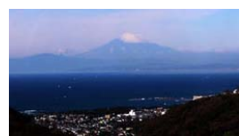
富士山を望む研修所